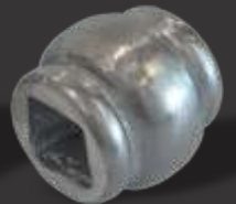
046 - Carretel bujão pequeno p/ ferro quadrado 20x20 Altura 4,5cm