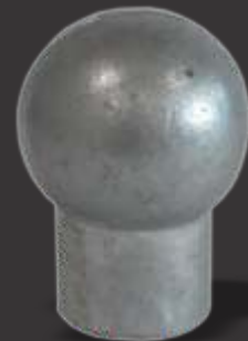
051 - Bolinha p/ ferro 3/8" diâmetro 31mm Altura 4,5cm