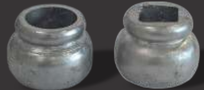
059 - Meio carretel 22mm Altura 3,3cm