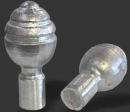
089 - Bola torneada 3/8"