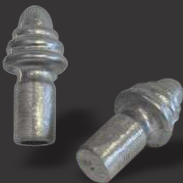
093 - Tubo 3 anéis maciço para cadeira ou grade pé 20mm Altura 7cm