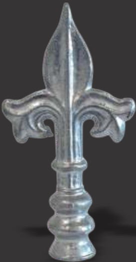
015 - Lança Coqueiro 3/8 Altura 15cm 016 - Lança Coqueiro 1/2 Altura 15cm 017 - Lança Coqueiro 5/8 Altura 15cm