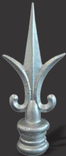
001- LANÇA DE 3 PONTAS DE 3/8"