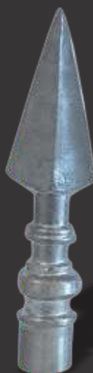
009 - Lança de 1 Ponta