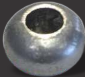
074 - Anueto pequeno 5/8" Diâmetro \varnothing 3,6cm