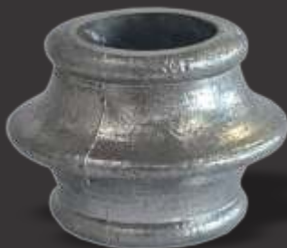
034 - Carretel disco 26mm Altura 3,5cm