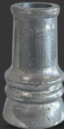
035 - Carretel duplo disco 26mm Altura 9cm