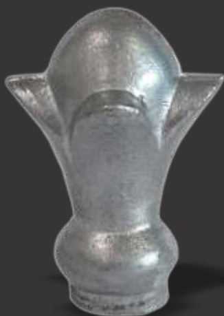
047 - Lírio 3/8" Altura 7cm