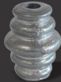
022 - Carretel 5 frisos 3/8" Altura 4,5cm