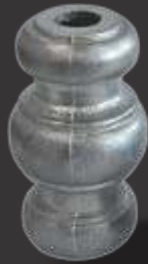
041 - Carretel 3 anéis 1/2" Altura 7cm