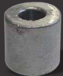
096 - Cilindro 1/2" Altura 3cm