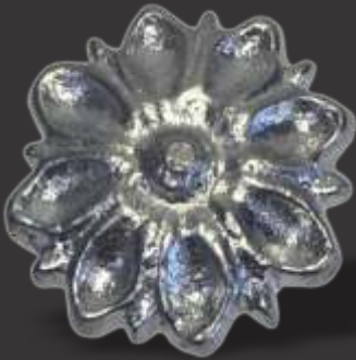
073 - Flor p/ enfeite diâmetro 4cm Diâmetro \varnothing 4cm