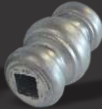
042 - Carretel 3 anéis p/ ferro quadrado de 1/2" R$15,00