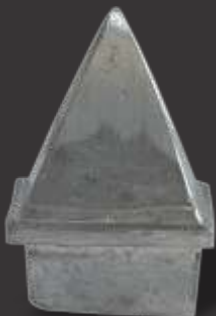
062 - Ponteira 50x30 Altura 8cm