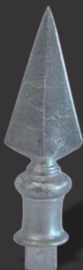
008 - Lança de 1 Ponta