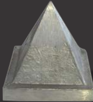
088 - Pirâmide 80x80 Altura 10cm