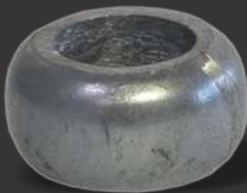
076 - Anueto médio furo 1" Diâmetro \varnothing 4,5cm