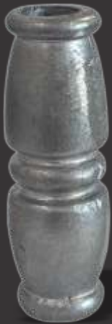
039 - Carretel c/ relevo no centro 1/2" Altura 9,5cm