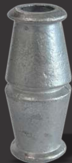
036 - Carretel c/ rebaixo no centro 3/8" Altura 7,5cm