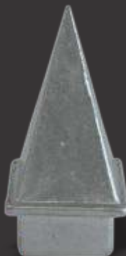
063 - Ponteira 30x30 Altura 7cm