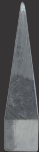
019 - Pirâmide Pontaguda para ferro quadrado 26mm Altura 14cm