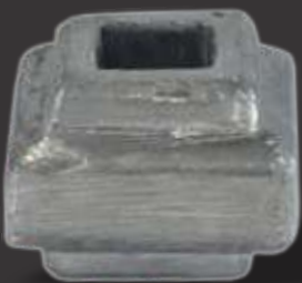
068 - Carretel quadrado 3/8" Altura 2cm