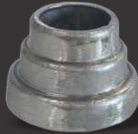
029 - Carretel 3 degraus 1 e 1/4 33cm c/ folga Altura 4cm Obs: Serve p/ corrimão e acabamento de base