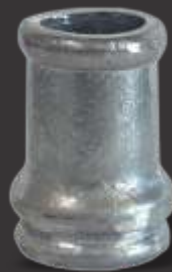
026 - Carretel conjunto c/ 025 23mm Altura 5cm