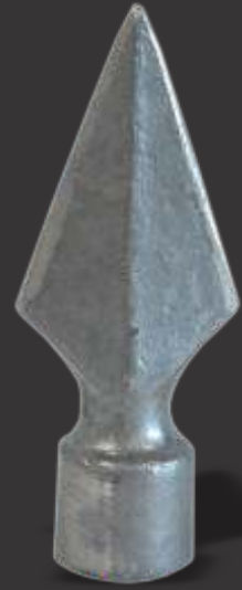
014 - Lança Média de 1 Pontas 1/2" Altura 9cm