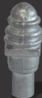
072 - Acabamento p/ cadeira Obs: o pé que entra no tubo 21mm Altura que sobra 5cm