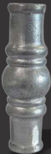
025 - Carretel bujão central 23mm Altura 13cm