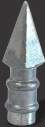
013 - Mini lança de 1 Ponta 1/2" Altura 8cm