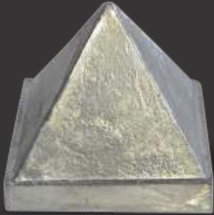
087 - Pirâmide 60x60 Altura 6,5cm