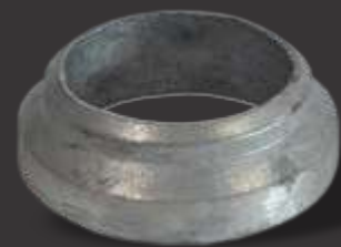
027 - Acabamento p/ corrimão 51mm Altura 2,2cm