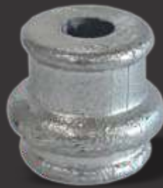
021 - Carretel 1 friso 3/8" Altura 2,5cm