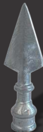
010 - Lança de 1 Ponta