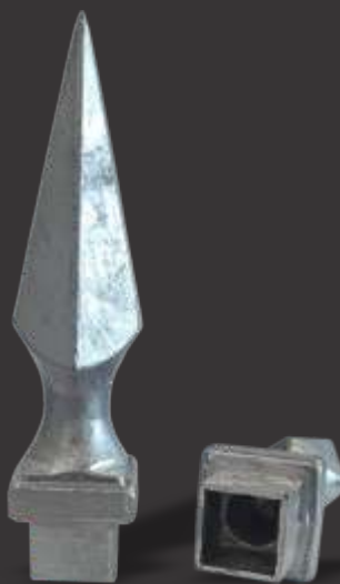
018 - Lança Pirâmide 20x20 para ferro 5/8 Altura 16cm