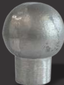
050 - Bola Grande p/ ferro 3/8" diâmetro 45mm - pé 26mm Altura 5,5cm