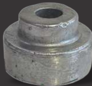
095 - Chapéu 1/2" Altura 3cm