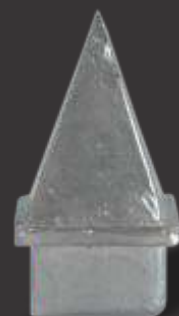
064 - Ponteira 30x20 Altura 5,5cm