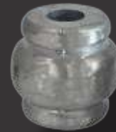
043 - Carretel bujão pequeno 1" Altura 4,5cm