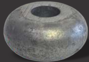
075 - Anueto grande furo 20mm Diâmetro \varnothing 6cm