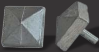
054 - Arrebite p/ portão 25x25 Altura 1,5cm