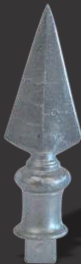
004 - Lança de 1 Ponta 3/8"