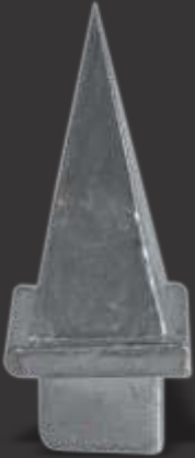
065 - Ponteira 20x20 Altura 6cm