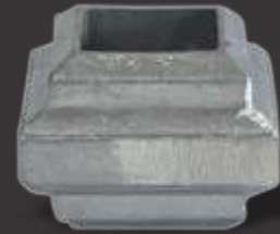
067 - Carretel quadrado 20x20 Altura 2,7cm