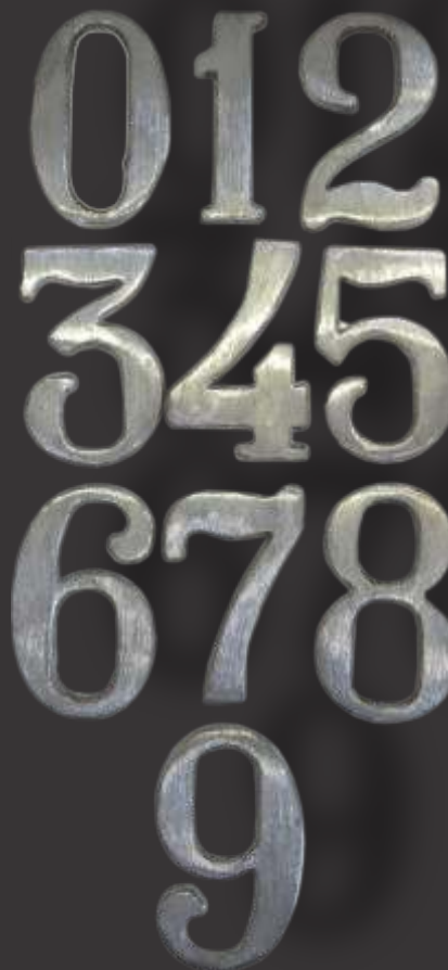
Números de 0 à 9 Altura 11cm