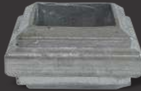
066 - Carretel quadrado 40x40 Altura 3,2cm