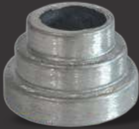
028 - Carretel 3 degraus 1" Altura 3cm Obs: Serve p/ corrimão e acabamento de base