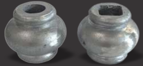
030 - Carretel bujão grande 19mm Altura 5cm