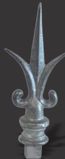
007-lança de 3 Pontas