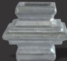
071 - Carretel quadrado centro maior Furação 20x20 Altura 4,4cm