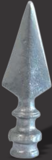
012 - Lança de 1 Ponta Intermediária 3/8" Altura 13cm