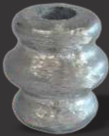
020 - Carretel p/ ferro redondo 12mm Altura 3,5cm